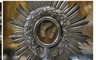
Relicario de santas Nunilo y Alodia de 1821, traído a Moreda en 1832.