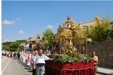
Procesión de las santas en Adahuesca.

Estando huérfanas estas dos jovencísimas hermanas fueron denunciadas ante el gobernador musulmán Zimael por incumplir las leyes musulmanas. Fueron llevadas prisioneras a la cercana fortaleza de Alquézar.