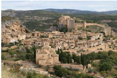
Pueblo de Alquézar próximo a Adahuesca, uno de los más bellos.

Estando huérfanas estas dos jovencísimas hermanas fueron denunciadas ante el gobernador musulmán Zimael por incumplir las leyes musulmanas. Fueron llevadas prisioneras a la cercana fortaleza de Alquézar.