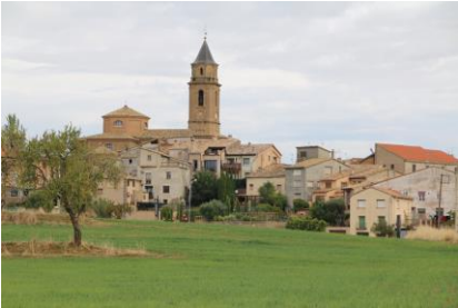
Pueblo aragonés de Adahuesca situado en el Somontano de Barbastro en la provincia de Huesca, a los pies de la vertiente sur de la Sierra de Guara.

Nacieron en el pueblo aragonés de Adahuesca en el siglo IX. Fueron hijas de padre musulmán y de madre cristiana siendo educadas en la doctrina cristiana. La casa la tuvieron, según la creencia popular, dentro del solar de lo que hoy es el templo parroquial de San Pedro de Adahuesca. Fue derruida la casa para agrandar la iglesia. Hoy donde estuvo su casa se halla erigida la capilla de las santas vírgenes Nunilo y Alodia (la primera a mano derecha según se accede a la iglesia) al lado de la epístola. Cerca, a los pies del altar de la Dolorosa debajo de una alfombra, se encuentra el pozo de agua a donde las Vírgenes acudían a diario para sacarla y llevarla a casa.