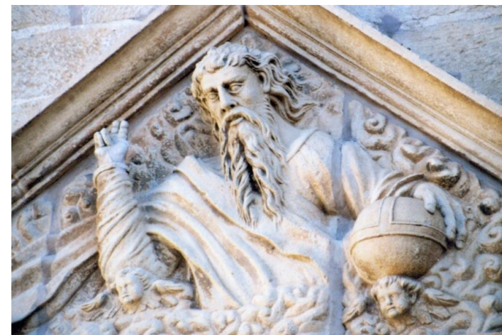
FRONTÓN – TÍMPANO