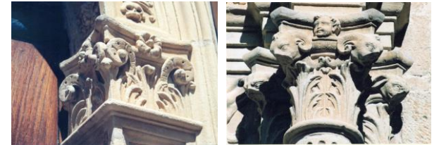
IMPOSTA – CAPITEL