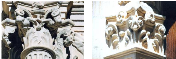
CAPITEL - IMPOSTA