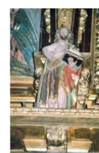
SAN JUAN BAUTISTA

UBICACION: Capilla Mayor en el presbiterio.